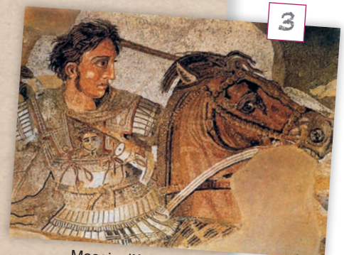
Mosaic d'Issos realitzat cap a 325 aC

Com a militar va destacar, ja als divuit anys, dirigint la cavalleria a la batalla de Queronea (338 aC). Als vint anys va succeir el seu pare Filippo II. Alexandre va dedicar els primers anys del regnat a imposar la seua autoritat sobre els pobles sotmesos a Macedònia, que havien aprofitat la mort de Filip per rebel·lar-se. I de seguida (l'any 334), va llançar el seu exèrcit contra el poderós i immens Imperi Persa. A partir d'aquest moment, el seu paper de conqueridor fou fulgurant: Grècia, l'Àsia Anterior, el Pròxim Orient, Egipte, l'Orient Mitjà, l'Àsia Central i... fins més enllà del riu Indus, a l'Índia. Literalment va escombrar els perses sense conèixer ni una sola derrota. Amb un exèrcit petit (uns 30.000 infants i 5.000 genets), Alexandre el Gran es va imposar sobre els enemics, gràcies a una organització i un ensinistrament excel·lents de les tropes i a un gran geni militar. La seua estratègia en les batalles encara és objecte d'estudi i d'admiració.