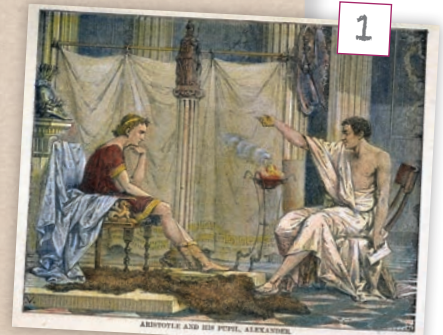
Gravat de Charles Lapante 1866